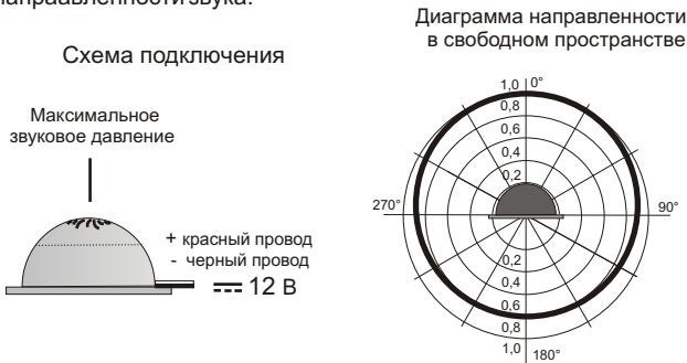
Рис.2 Схема подключения и диаграмма направленности звука оповещателя.

5.3. На рис.2 показана схема подключения и диаграмма направленности звука.