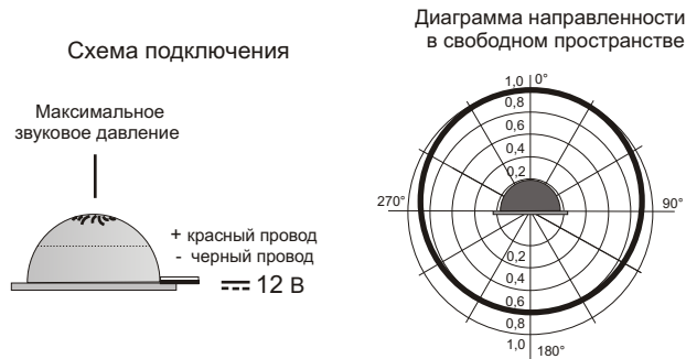
Рис.2 Схема подключения и диаграмма направленности звука оповещателя.

5.3. На рис.2 показана схема подключения и диаграмма направленности звука.