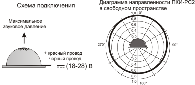
Рис.2 Схема подключения и диаграмма направленности Оповещателя ПКИ-РС2.

5.2. На рис.2 показана схема подключения и диаграмма направленности звука оповещателя ПКИ-РС2.