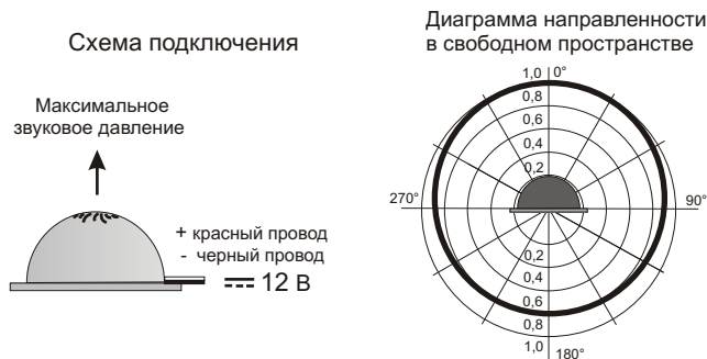
Рис.2 Схема подключения и диаграмма направленности оповещателя.

5.3. На рис.2 показана схема подключения и диаграмма направленности звука оповещателя.